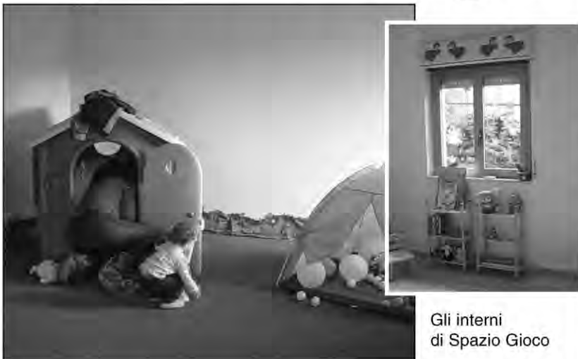
Gli interni di Spazio Gioco

Il genitore o la figura di riferimento adulta che accompagna il bambino è libero di osservare il proprio piccolo in un contesto relazionale differente dalla famiglia. L'incontro tra genitori, inoltre, facilita il confronto e lo scambio sulle proprie esperienze educative e ciò potrà sostenere lo sviluppo di relazioni e legami che vadano oltre il contesto "Spazio Gioco" in un'ottica di promozione dell'appartenenza alla comunità locale e di ri-scoperta delle responsabilità educative condivise.