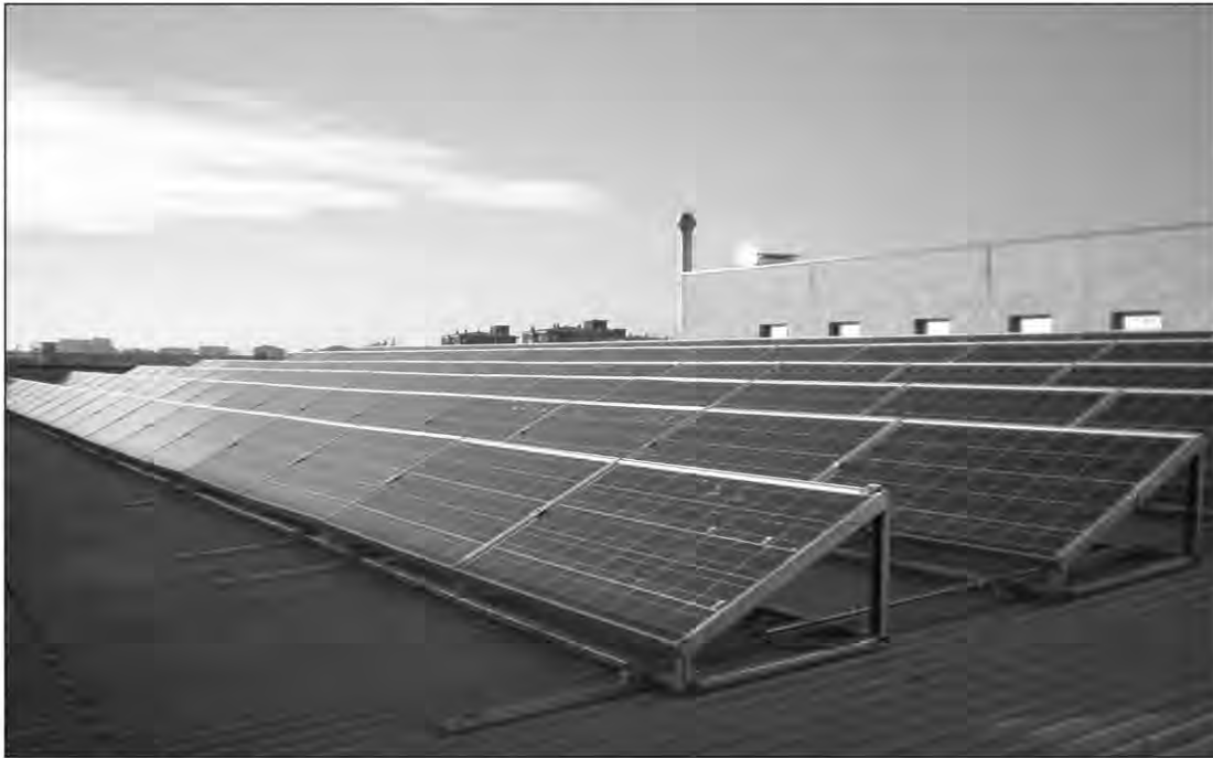
Un impianto fotovoltaico

La seconda opera riguarda il progetto, finanziato dalla Regione Calabria, per la realizzazione dell'illuminazione pubblica nelle aree rurali montane Rumia-Piani d'Aspromonte per un importo di 299.700 euro. L'intervento consiste nella realizzazione dell'illuminazione