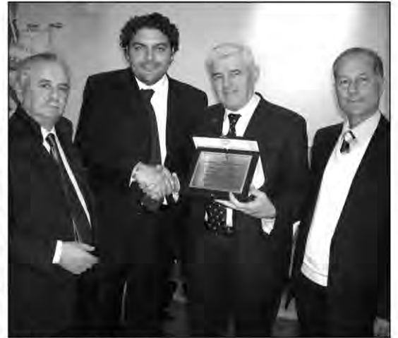
L'incontro di Desio